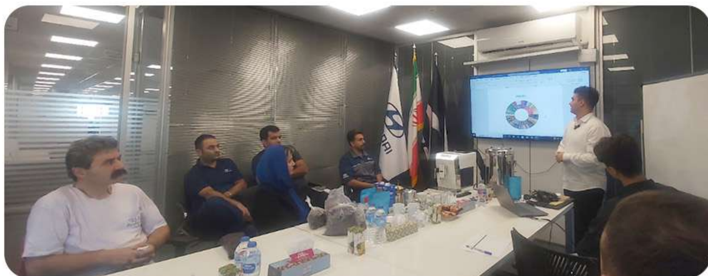
مدیریت حل تعارض

کارگاه های زیر توسط واحد آموزش ستاد برای همکاران KTL در آبان ماه برگزار گردید باریستای مقدماتی