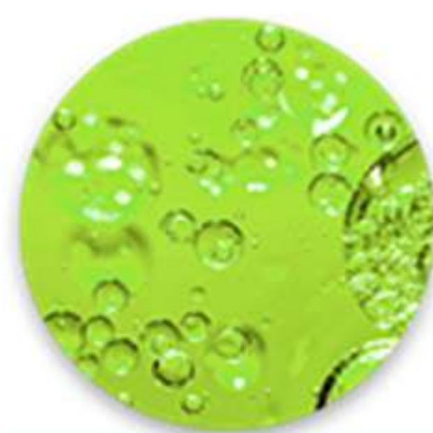
BUBBLES ALONG COOLING SYSTEM