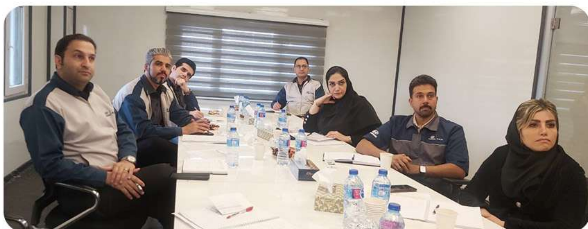
قطعه شناسی عمومی